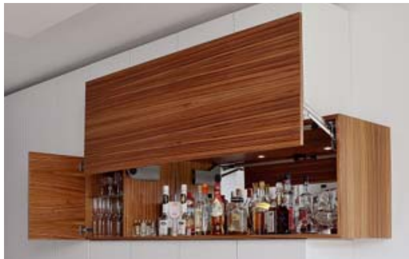
Eingeschoben: Ein in Zebano horizontal furnierter Kubus mit Tür und breiter Klappe wird als Barfach genutzt

beitszimmer gedachter Raum mit Lesecke. Anstelle eines Durchbruchs zum Wohnzimmer, wurde ein vollflächig verspiegelter, raumhoher Garderobenschrank eingebaut. Am Stirnende des Raumes platzieren die Planer ein offenes Regal